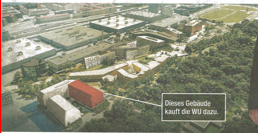
Dieses Gebäude kauft die WU dazu.