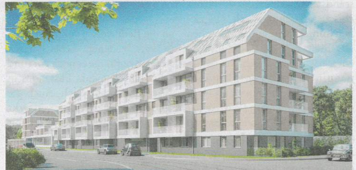
In der Preyergasse 1–7 (1130) ist die Auswahl (noch) etwas größer.