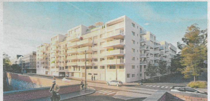
In der Huttengasse im 16. Bezirk sind nur noch drei Wohnungen frei.

Höchste Achtsamkeit wird auch der Betreuung gewidmet. „Wir kümmern uns lange über den Kauf hinaus um unsere Kunden“, sagt Weinberger-Fritz. „Alseinzigster Anbieter offerieren wir ein Rundum-Sorglos-Paket!“ Die RVW-Projekte sind daher echte „Renner“ und fast alle noch vor der Fertigstellung „ausgebucht“. Das zeigt sich aktuell etwas sowohl in Ottakring wie in Hietzing. In der Huttengasse 27 sind nur noch drei Wohnungen zu haben, in der Preyergasse 1–7 kann derzeit noch etwas mehr hochqualitativer Wohnraum geboten werden. Beide – bestens ausgestattete – Objekte bestechen durch hervorragende Standortqualität laut dem RVW-Grundsatz „ausgezeichnete Verkehrsanbindung, medizinische Versorgung, vielfältiges Schulangebot für alle Altersstufen, mit einem Wort: optimale Infrastruktur“. Auch und gerade in kritischen Zeiten! Nähere Infos: www.rvw.at