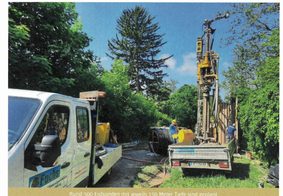
Rund 500 Erdsonden mit jeweils 150 Meter Tiefe sind geplant

Wie groß das Areal ist, beweist allein eine Auflistung der jeweiligen Flächen: Das Projektareal für die Neugestaltung umfasst 272.000 Quadratmeter, dazu zählen 34 Gebäude exklusive der Otto-Wagner-Kirche. Die weiteren Areale weisen ebenfalls statt- »