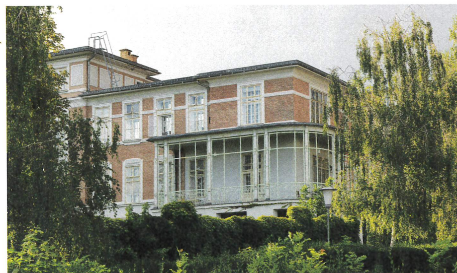
Ab nun wird die technische Infrastruktur rund erneuert. Moderne Haustechnik und innovative Energielösungen machen die Gebäude zukunftsfähig. Erhalten bleiben dabei die denkmalgeschützte Architektur und der herrliche grüne Baumbestand